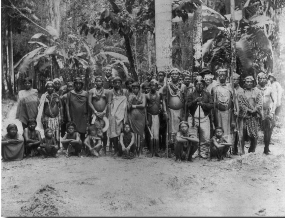
Immagine di una tribu Arawak realizzata nel 1880.